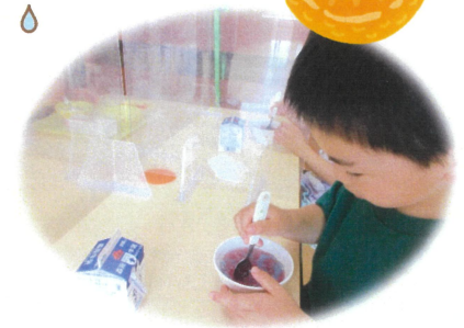
最初にぶどうゼリーを混ぜます。ぶどうゼリーを混ぜたら、ソーダゼリーも一緒に混ぜます。