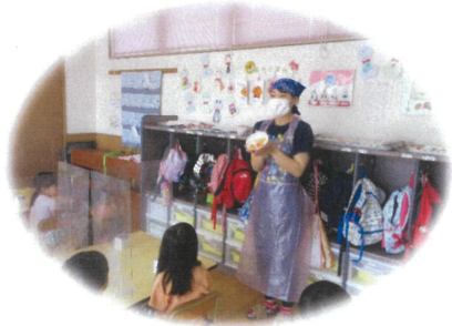
作り方の説明を聞いています。